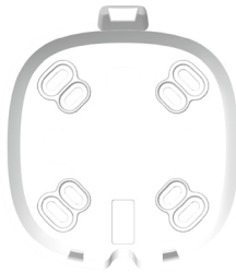
2. DE MONTAGEPLAAT